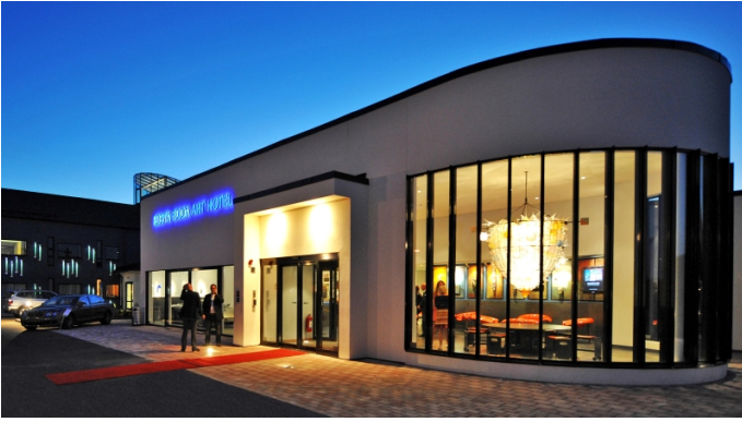
Kosta Boda Art Hotel 4*